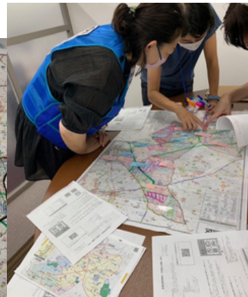
都立大駅周辺薬局合同で 開催したDIGの様子(令和6年8月)